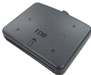
シャープ製：SSC-001 対応：Windows7まで