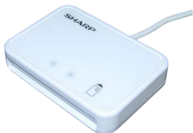
シャープ製：RW-5100 対応：Windows8.1まで