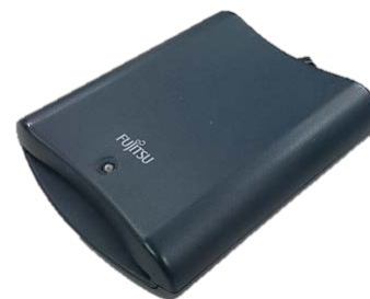
富士通製：F3972G403 対応：Windows7まで (現ICカード非対応)