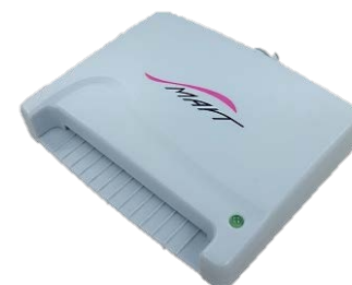
スマートワイヤレス製：ACR-30U 対応：WindowsVistaまで (現ICカード非対応)