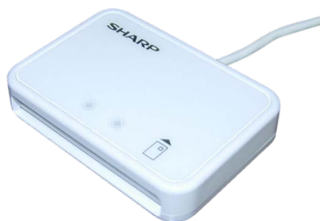
シャープ製：RW-5100 対応：Windows8.1まで