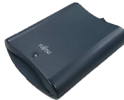
富士通製：F3972G403 対応：Windows7まで (現ICカード非対応)