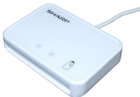
シャープ製：RW-5100 対応：Windows8.1まで