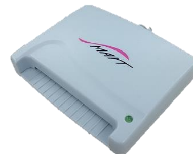
スマートワイヤレス製：ACR-30U 対応：WindowsVistaまで (現ICカード非対応)