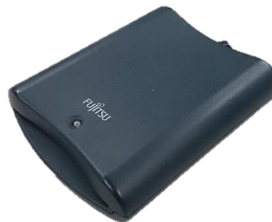
富士通製：F3972G403 対応：Windows7まで (現ICカード非対応)