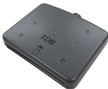
シャープ製：SSC-001 対応：Windows7まで