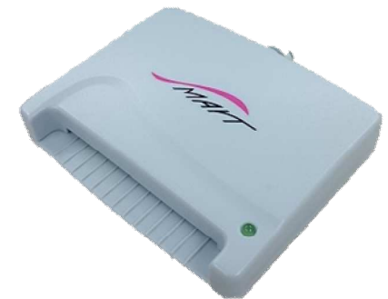
スマートワイヤレス製：ACR-30U 対応：WindowsVistaまで (現ICカード非対応)