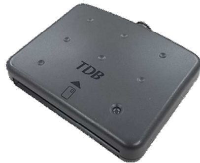
シャープ製：SSC-001 対応：Windows7まで