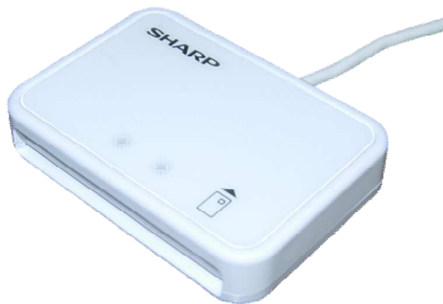
シャープ製：RW-5100 対応：Windows8.1まで